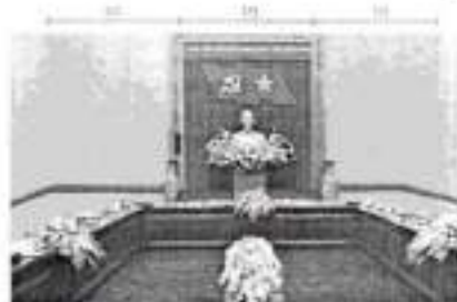
Hình 4b (kích thước hội trường lớn)