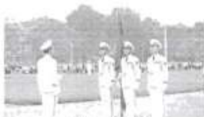
Hình 23a (cảnh cờ)

Điều 13. Cảnh, rước cờ Đảng khi tổ chức các hoạt động, mít tinh, diễn binh, diễu hành