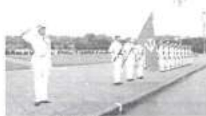
Hình 23b (giương cờ)