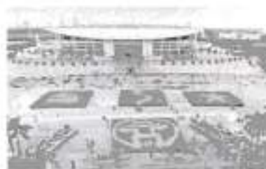
Hình 32 (sắp hình người)