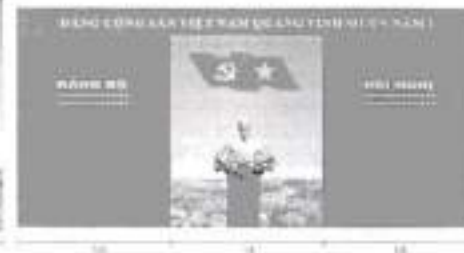
Hình 4a (kéo ô thêu: hội trường rộng)