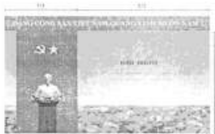
Hình 5a (cờ xếp dọc)