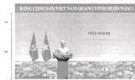
Hình 2 (Cờ có cán)

Điều 5. Trưng trí khánh tiết hội trường, phòng họp, phòng tiếp khách, phòng truyền thống và khuôn viên của cơ quan, đơn vị