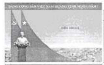
Hình 5c (cờ xếp chéo đôi)