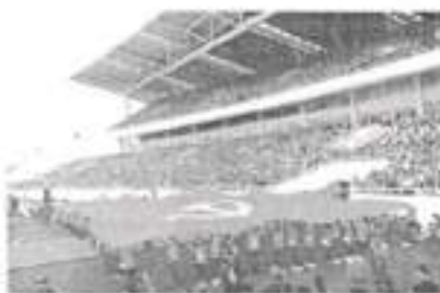
Hình 24a (rước cờ vào)