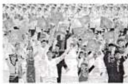
Hình 23d (vác bóng tay)