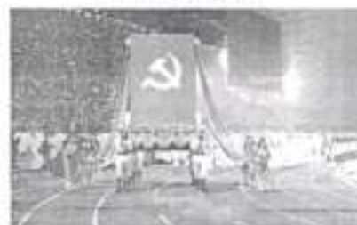
Hình 24c (rước trên kiệu)