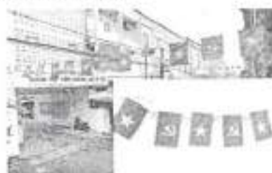
Hình 16b (cờ dây)