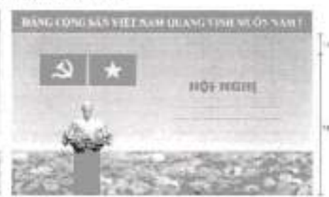
Hình 3a (cờ không tạo sóng)