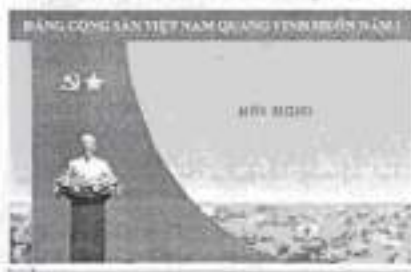
Hình 5b (cờ xếp chéo đơn)