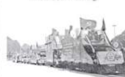
Hình 24d (rước bằng xe)