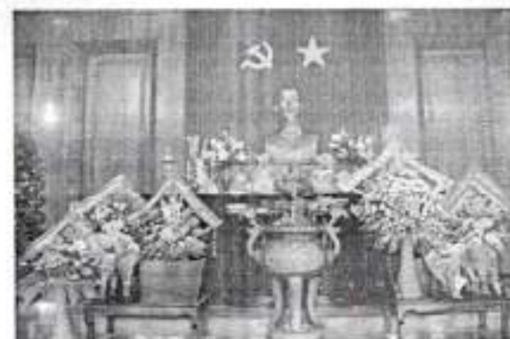
Hình 21c - Trong đền thờ chính

Điều 12. Nơi tổ chức các hoạt động đối ngoại đảng, ngoại giao nhà nước