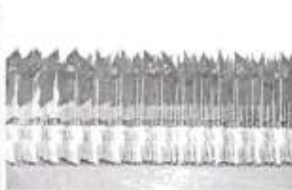
Hình 24b (rước theo hàng)