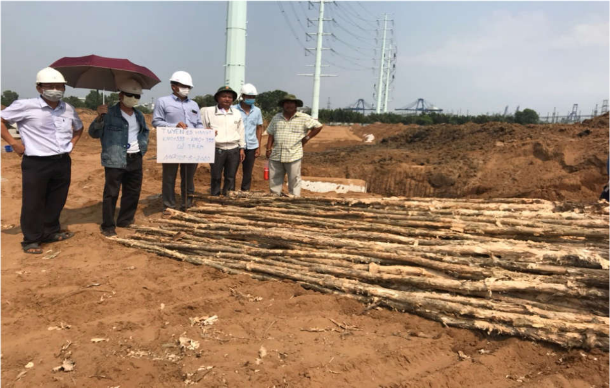
Kiểm tra củ Tràm