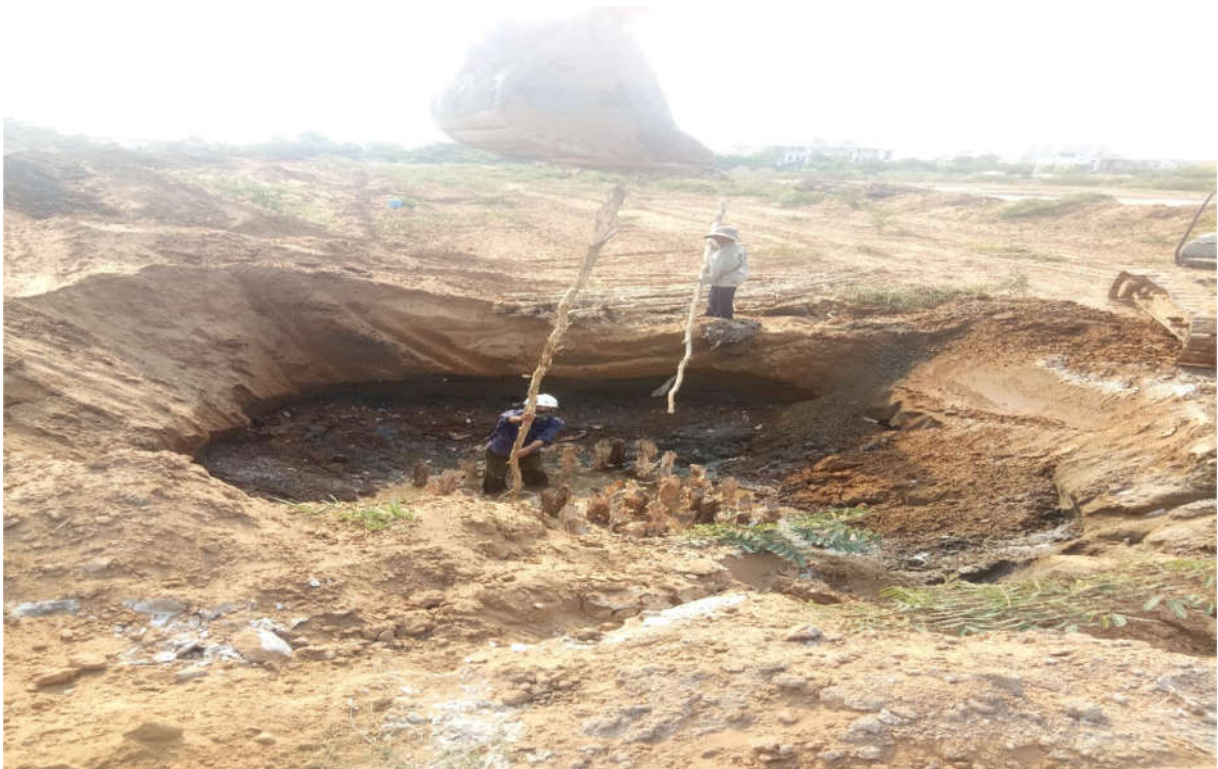
Thi công đóng cừ tràm hồ ga