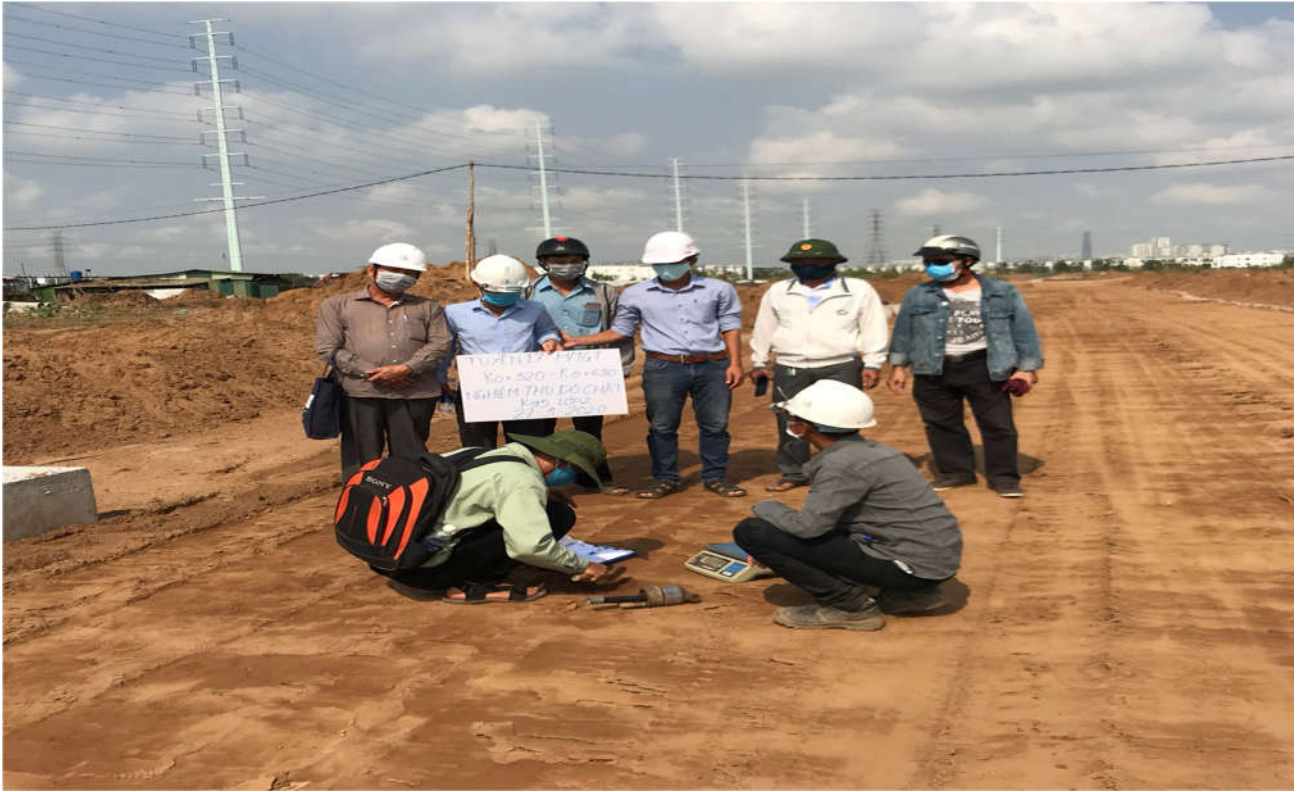
Kiểm tra độ chặt K 95, đường 17