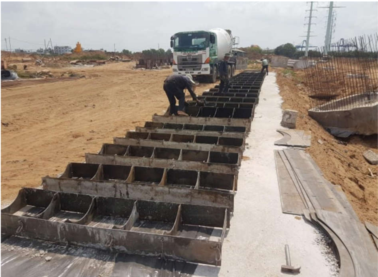
Thi công lắp đặt ván khuôn gói cống