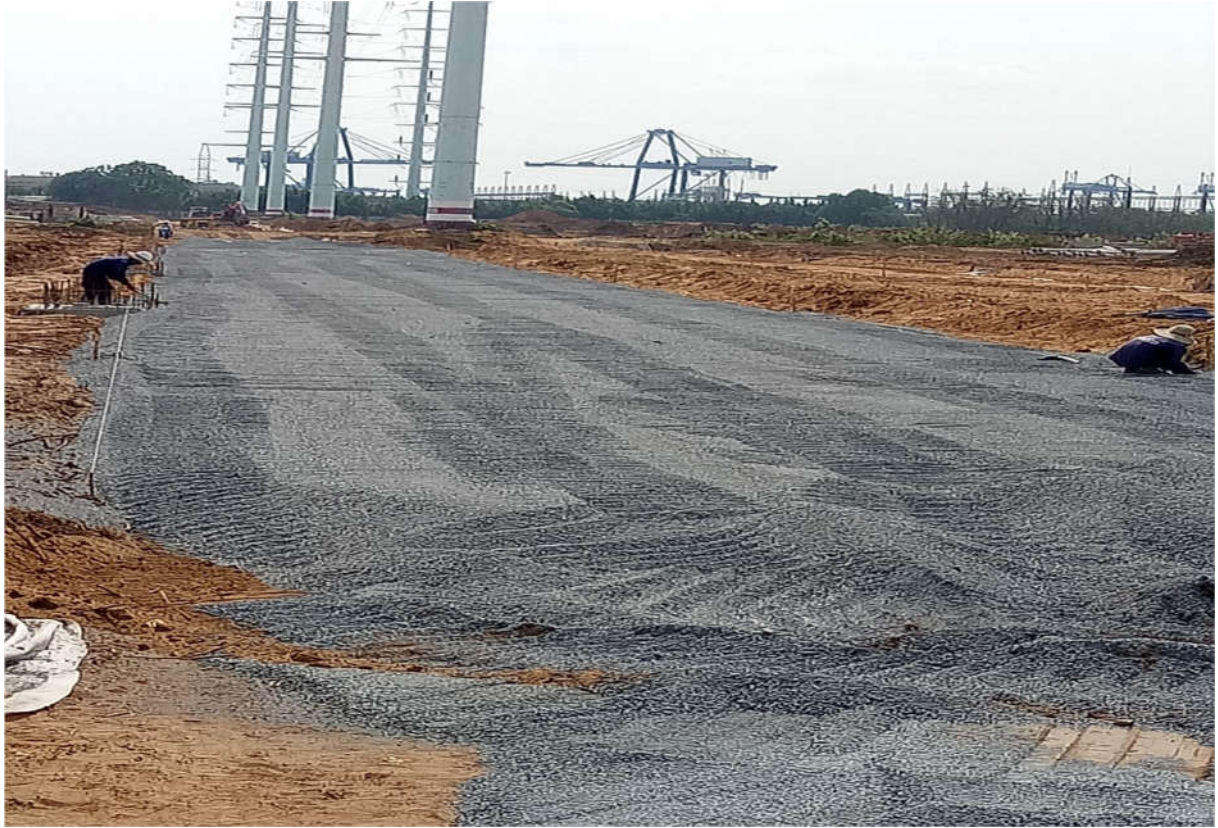
Thi công trải đá mi nền đường